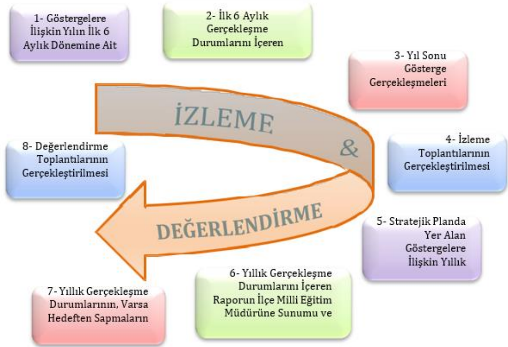
Şekil 1 Stratejik Plan İzleme ve Değerlendirme Modeli